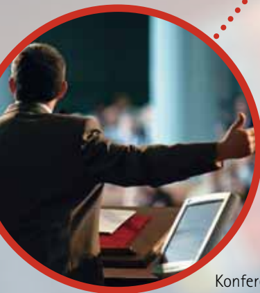
Konferenzen und Reden